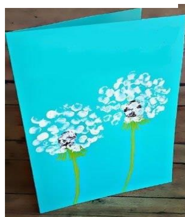
Рисунок ватными палочками