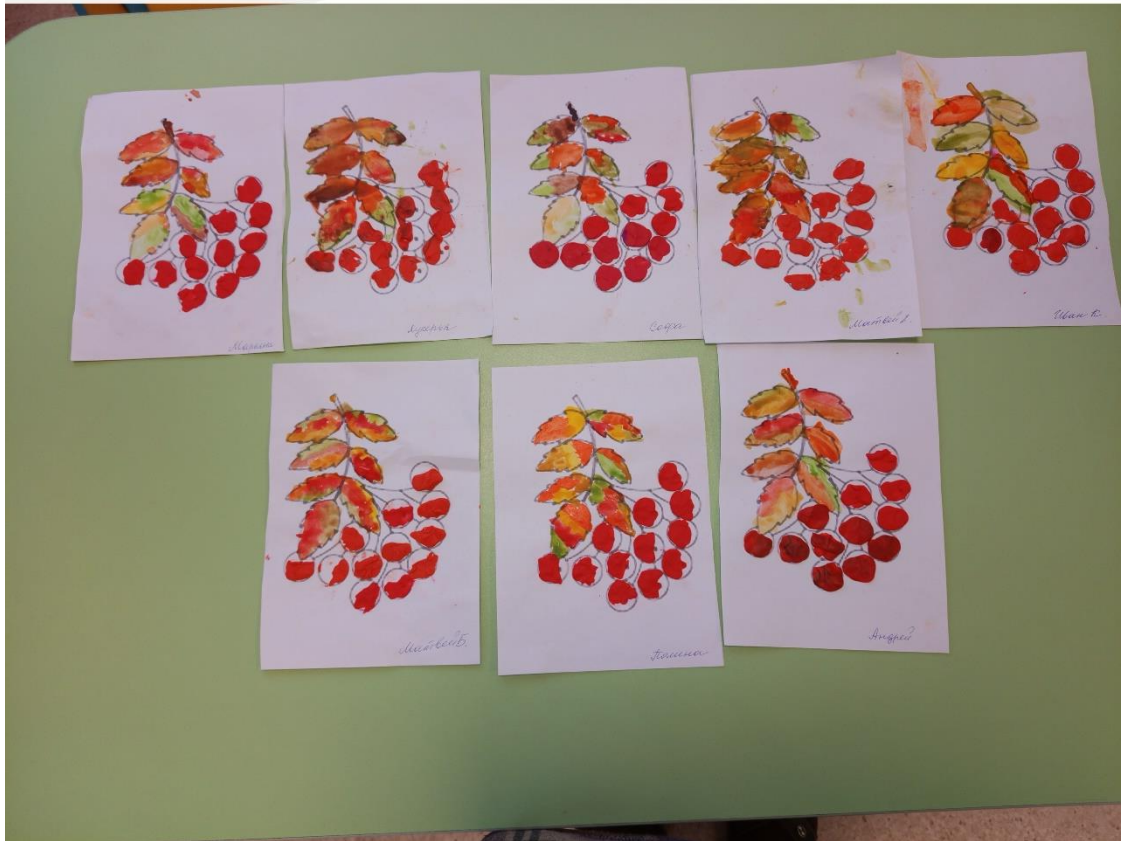
Рисование «Грозди рябины»