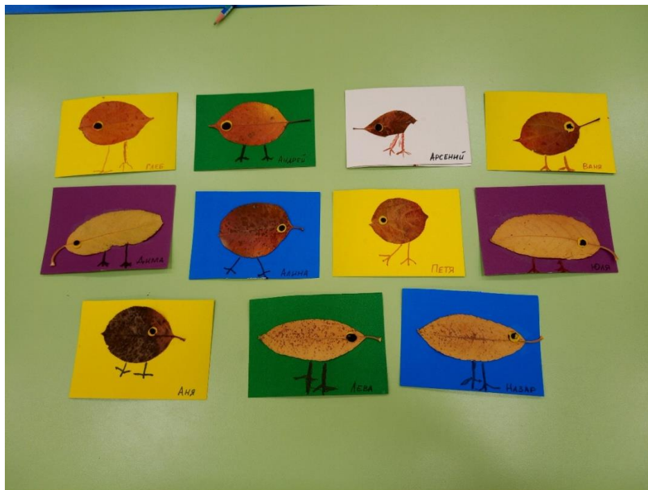
Аппликация из сухих листьев «Птички-невелички»