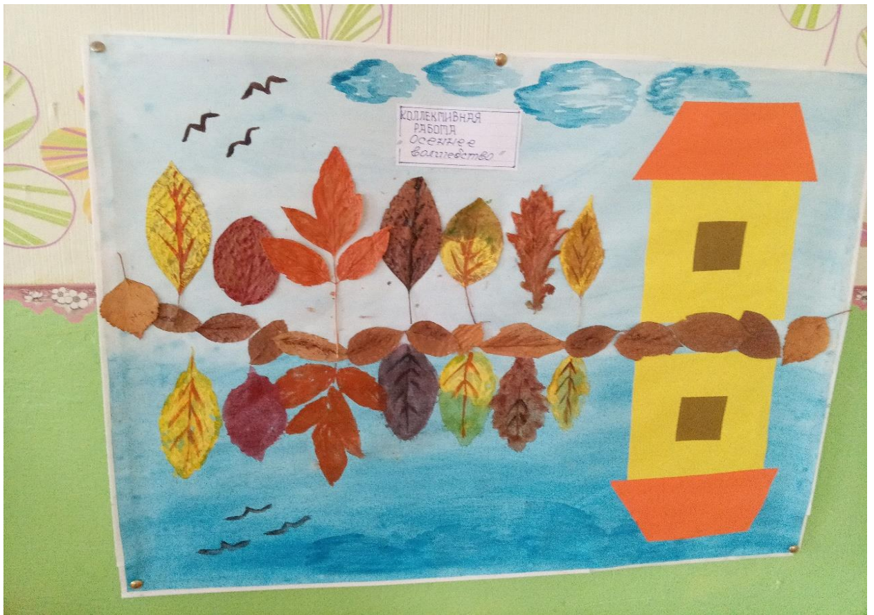
Коллективная работа «Осенний калейдоскоп»